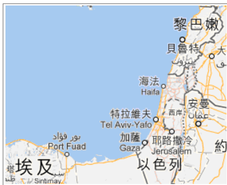
黎巴嫩国位于以色列以北。注释 1

以西结书 29:17 二十七年正月初一日[公元前 571 年 4 月 26 日]，耶和華的话临到我说：18‘人子啊！巴比伦王尼布甲尼撒使他的军兵千辛万苦攻打推罗，以致各人都头秃肩破；但是他和他的军兵攻打推罗所付出的辛劳，并没有从那里得到什么报酬。