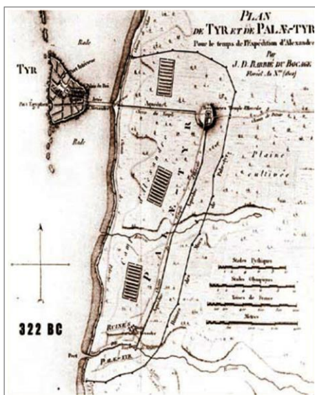
在亚历山大围攻时，推罗岛和大陆是分开的。以上地图显示了亚历山大修建的堤道。注释 1

预言的第二部分（7-11 节）着重讲述袭击推罗的第一波侵略者：尼布甲尼撒，他将应