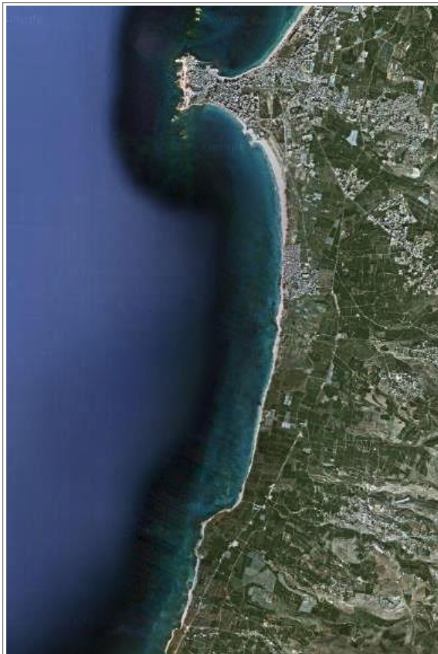
古推罗岛城遗址（图片顶端的半岛）以南超过六公里的黎巴嫩海岸，旧推罗的大陆城曾坐落于这一带。岸边的白色细带是沙滩，绿色的是田野。注释 1

推罗坐落在完美的商贸地段，水源充裕，又有悠久的历史，似乎注定要永远长存。而且，古代的得胜者还重建了大部分毁于战争的城市，使其人口也得到恢复。毕竟，将城摧毁，变成荒无人烟的废墟，还不如保留城市，从中获取贡礼和奴隶。更何况在古代，人们对于城址的选择是非常谨慎的，也不会轻易弃城。然而以西结却十分肯定推罗将永不得重建。 146