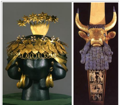
在吾珥城布阿毕（Puabi）女王皇家陵墓中发现的公元前 2500 年左右的文物，工艺精湛。这要比亚伯拉罕时期早了几个世纪。注释 1