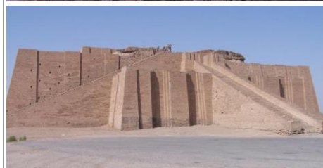
上图：古代吾珥城遗址的航拍图。下图：经过部分修复的吾珥城神殿。这座神殿塔大致建于公元前 2100 年左右，用于供奉月亮神南纳。注释 1