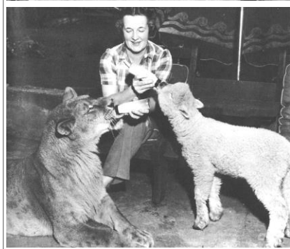
从来不吃肉的母狮子。注释 1